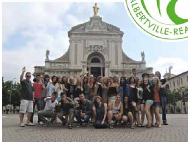
von Heinz Rupp

Was nach dem Amoklauf als Schicksalsgemeinschaft begann, entwickelte sich rasch zu einem festen Bestandteil der Albertville-Realschule in Winnenden. Viele Schüler sind begeistert von der Idee, Kirche an ihrer Schule zu haben. Sie planen, organisieren und leiten verschiedene Projekte. Kirche ist plötzlich in ihrer eigenen Schule möglich, spürbar und erfahrbar geworden. Im Raum der Stille & Seelsorge, können sich Schüler oder Lehrer zu jeder Zeit zurückziehen oder zum Austausch zusammenkommen. Bei den monatlichen Treffen im CVJM-Haus wird geplant, organisiert und nach guten Lösungen gesucht. Damit die jungen Menschen ihre Ideen auch in die Tat umsetzen können, unterstützt uns die Firma Kärcher jährlich mit einer Projektleiterschulung. Auch Jugendliche aus den Kirchengemeinden sind hierzu eingeladen. Die spirituellen Angebote werden von unseren Schülern sehr gerne angenommen. Ob es nach Assisi oder ins Kloster geht oder auch bei der Vorbereitung der Schulgottesdienste und